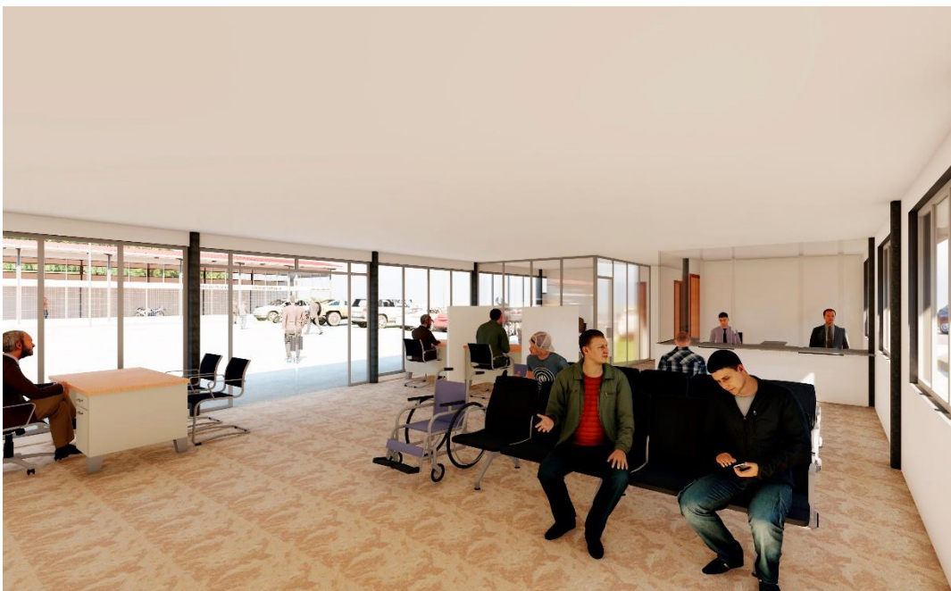
Vista interior del Bloque Administrativo del Centro de Revisión Técnica Vehicular del cantón Celica