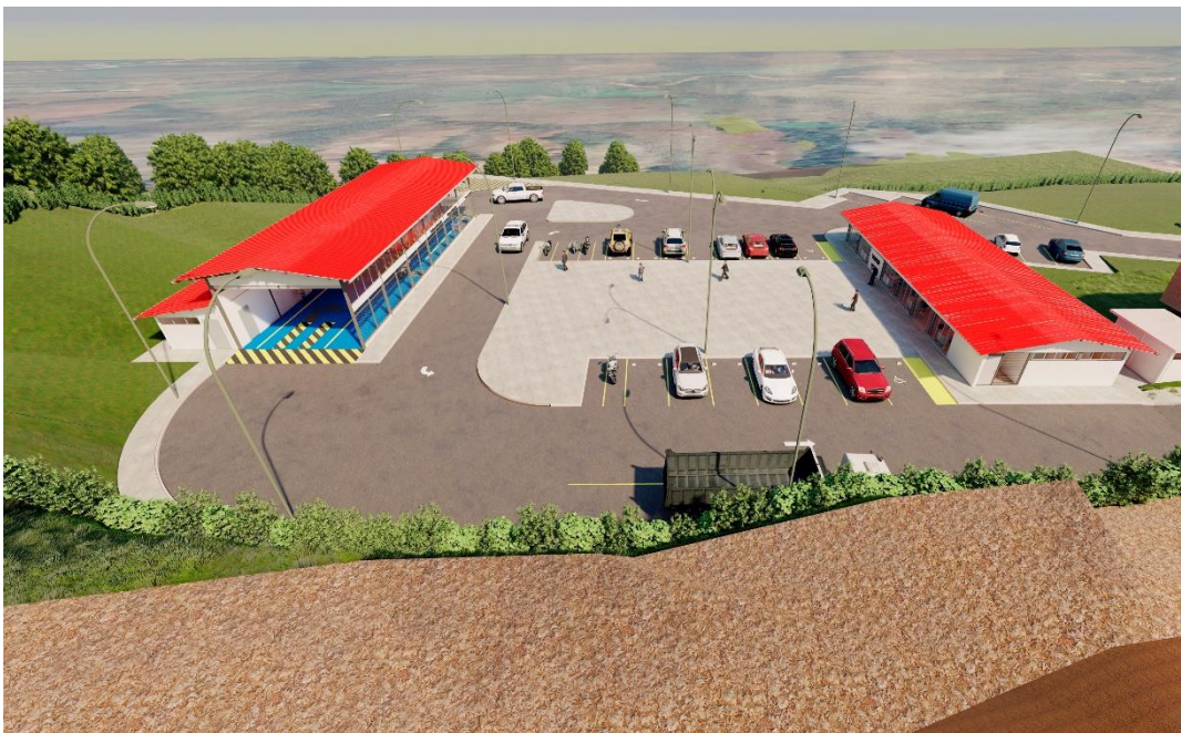
Vista aerea oriental del Centro de Revisión Técnica Vehicular del cantón Celica