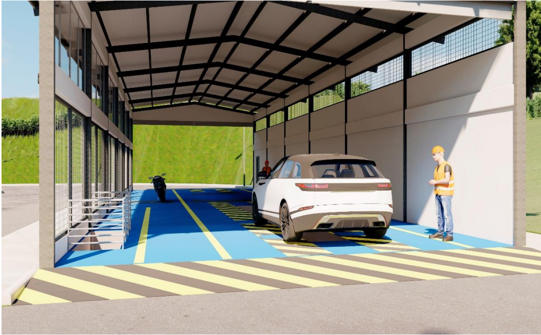
Vista interior del Bloque de Revisión Técnica del Centro de Revisión Técnica Vehicular del cantón Celica