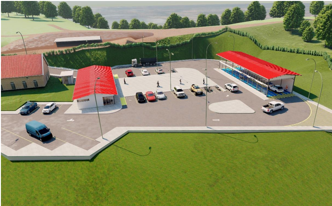
Vista aérea occidental del Centro de Revisión Técnica Vehicular del cantón Celica