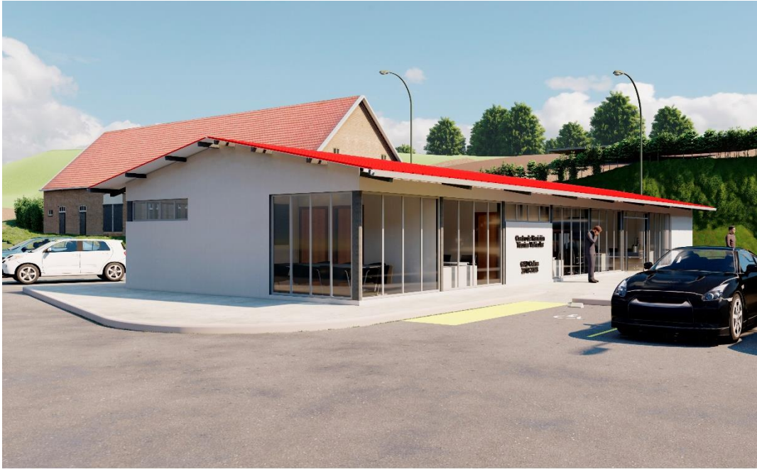
Vista exterior del Bloque Administrativo del Centro de Revisión Técnica Vehicular del cantón Celica