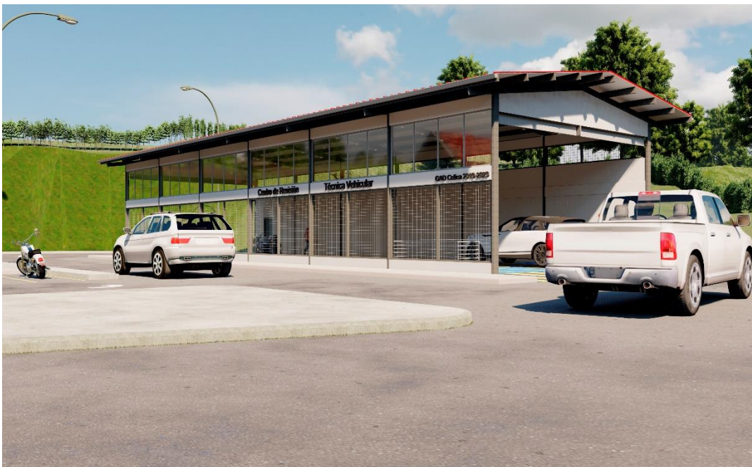
Vista exterior del Bloque de Revisión Técnica del Centro de Revisión Técnica Vehicular del cantón Celica